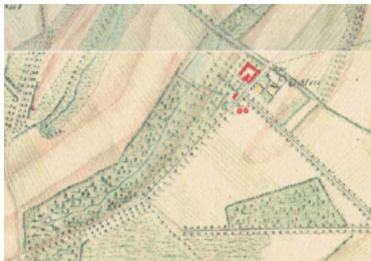
1771-1778. Carte de Ferraris, détail (Kaart van de Oostenrijkse Nederlanden). Bibliothèque Royale Brussel.