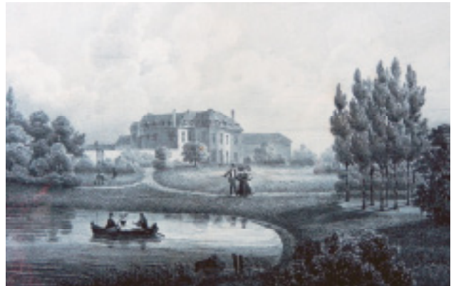
Het kasteel rond 1830.