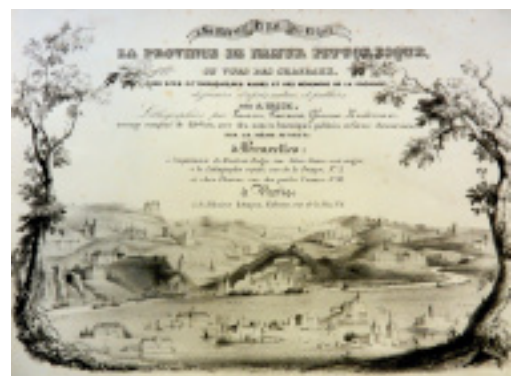
J. J. de Cloet. Album pittoresque des Pays Bas, faisant suite au voyage pittoresque. Pl. 9. A. Peellaert del.; Sturm litho. Parkaanleg met padenstelsel tussen park en huis. Langs het voetpad staat een kinderschommel.

a été bâti par M. Deckers (andere bronnen noemen hem Dukers, red.), architecte de Liège, et les jardins ont été exécutés d'après les plans et dessins de M. Zocher, architecte distingué de Harlem.'