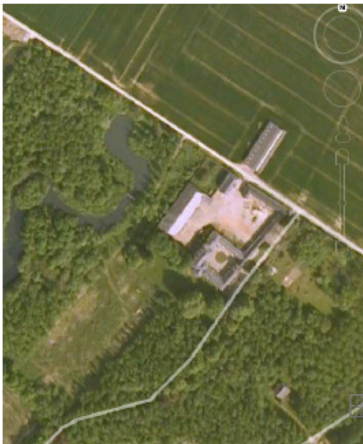
Google Earth 2011.

Tussen de Ancienne Chaussée de Namur (N934) en de weg van Brussel naar Luxembourg (E411) en langs de Rue d'Ostin ligt Chateau d'Ostin (Wallonië, Provincie Namur, Gemeente La Bruyère). Verslag van een bijzondere ontdekkingstocht naar dit kasteel in het Belgische Zuiden.