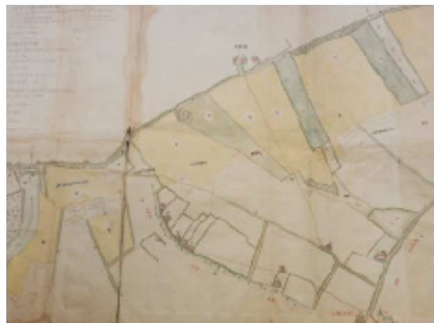
Chateaud'Ostin in 1720.

Op zoek naar bronnen over dit kasteel vond ik het boek 'Châteaux et monuments des Pays-Bas' met daarin een verwijzing naar een tuinarchitect Zocher. 'Le château d'Ostin apparaît en venant de Villers et de St. Denis au bout d'une avenue longue, belle et large, formée par quatre rangées de tilleuls et d'ormes nouvellement plantés. Il