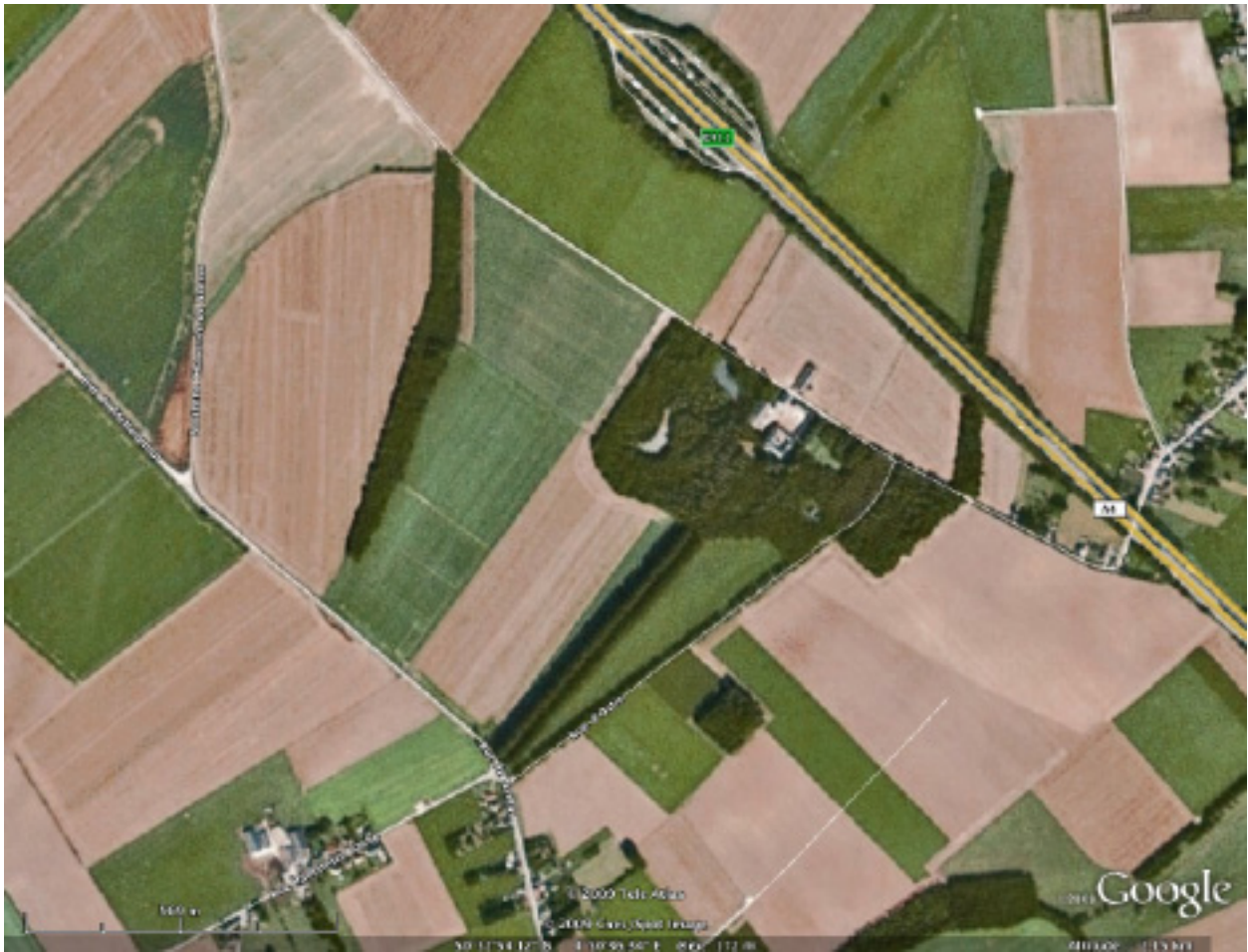
De situatie in 2009.

zijde en komt weer terug op het beginpunt. Het andere pad gaat niet over de brug, maar begint aan het noordelijke einde van de vijver, volgt de noordelijke, westelijke en zuidelijke randen van het park en komt uit op de toegangslaan. De bloemheesters zijn niet meer getekend. Waarschijnlijk waren ze er in die tijd nog wel. Aan de overzijde van kasteel en toegangslaan ligt, uitgespaard in het bos, sinds de tweede helft van de 18 e eeuw nog steeds het moestuincomplex.