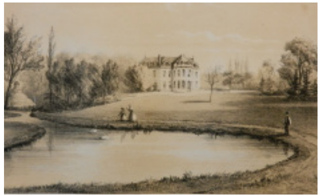
Vasse. La province de Namur pittoresque, ou vues des châteaux, des sites pittoresques, des ruines et des monuments de la province. Bruxelles, 1844, Tome I, Pl. 36, J.-B. Kindermans del. In het park ligt een ijskelder met koepel verscholen.